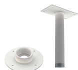
天吊金具 TH-ZOP115 本体希望小売価格 ¥30,000-(税別)